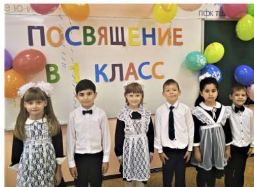
Ученики 1 «А»