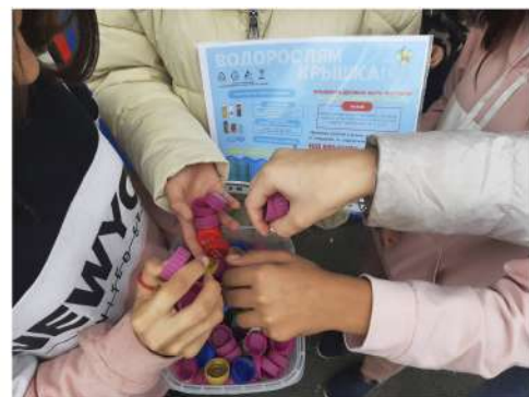
Материалы полосы подготовили: Кира Лыкова и Ирина Александровна Роде